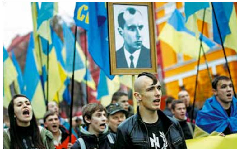
Тридцать лет на Украине выращивали, культивировали радикальный национализм и ненависть к России

Ну, так они и ведут себя за кордоном соответственно — поливают грязью руководство страны, нашу армию, оскорбляют собственный народ и т. п., с ними-то как раз все понятно.