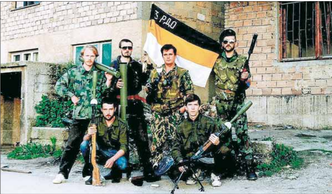
Группа бойцов с имперским знаменем 3-го Русского добровольческого отряда. Босния и Герцеговина. 1993-1994 годы

дежурство, дозоры, рейды, доставка продовольствия. Погода постоянно менялась, оттепели чередовались с метелями и снежными заносами.