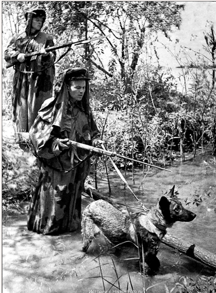
«Зелёные фуражки» в дозоре. Фотография сделана для газеты на одной из застав. Западная граница СССР. 20 июня 1941 года