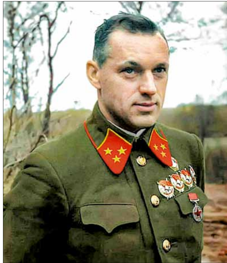
Будущий Маршал Победы Константин Рокоссовский. Летом 1941 году он не растерялся, не потерял голову, а проявил железную волю и талант настоящего командира

14 сентября к Сталину напрямую обратился подчиненный Кирпоноса, начальник штаба фронта генерал Тупиков (вчерашний военный атташе СССР в Берлине) и предложил отвести войска, иначе катастрофа неизбежна.