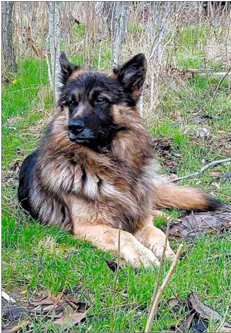
Заметив, что бойцы убегают от дронов-камикадзе, «Балбес» однозначно расценил это, как угрозу для его близких товарищей

На конкурс можно присылать рассказы, очерки, эссе, новеллы, стихи. Присланные произведения не редактируются, не рецензируются и не возвращаются.