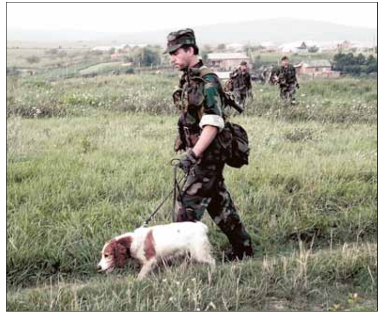
«За мою кинологическую службу в спецназе ФСБ было много разных событий — и веселых, и курьезных, и трагических»

Подготовить собаку на поиск взрывчатых веществ, оружия и боеприпасов мне помог один из корифеев отечественной пограничной кино-