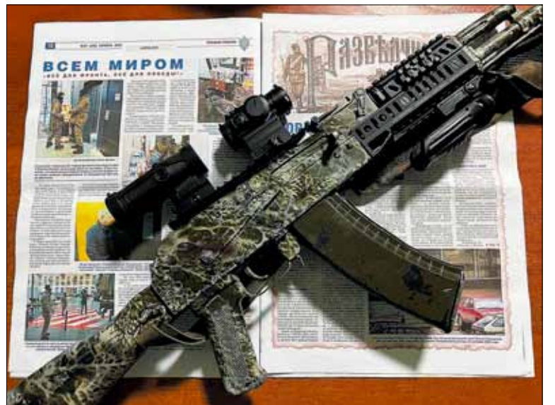
Лучшие литературные и поэтические произведения будут публиковаться на площадках газеты «Спецназ России» и журнала «Разведчик»

Человек смотрит вверх... «Птичка... Фу, рядом!»