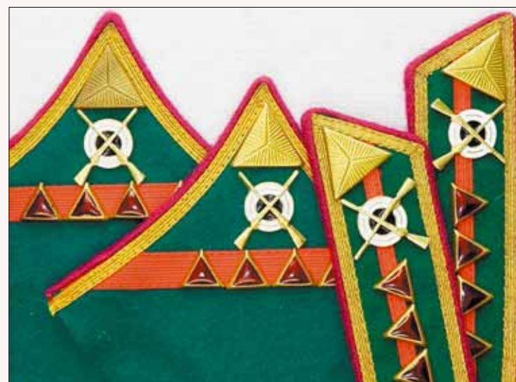
Петлицы младшего командного состава Пограничных войск НКВД СССР