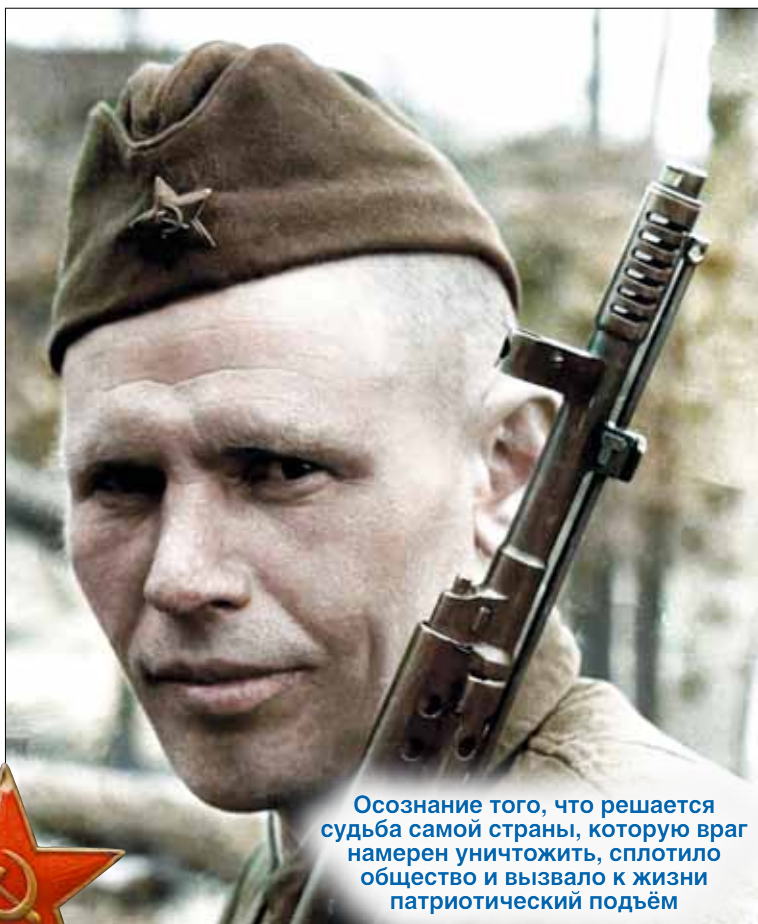
Осознание того, что решается судьба самой страны, которую враг намерен уничтожить, сплотило общество и вызвало к жизни патриотический подъем

Да, Сталин, как глава государства, сосредоточивший на тот момент в своих руках всю полноту власти, несет личную ответственность за трагические события 1941 года. Его вина в том, что такие люди, как Павлов или Кирпонос, были назначены командующими ключевыми военными округами, а начальником Генерального штаба РККА стал Жуков.