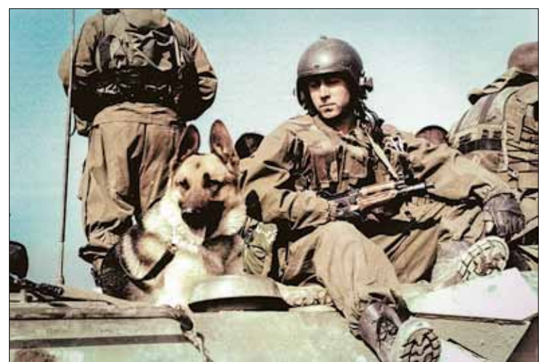
«Век служебной собаки недолог, и приходит момент расставания с боевым напарником»

Джесси прошла первую, вторую, третью машину, а у джипа охраны президента начала громко лаять и прыгать, всем видом показывая на наличие взрывчатки. Сотрудники безопасности начали напрягаться.