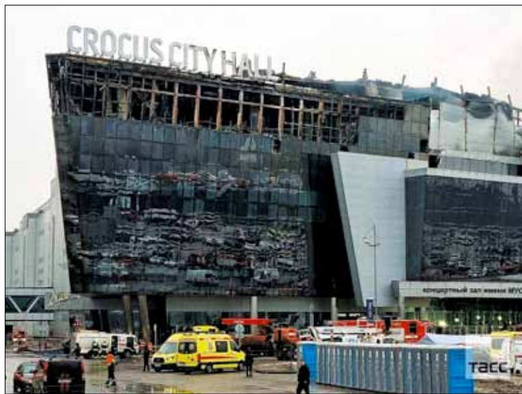
«Можно задать ещё с десяток «почему», связанных с этой ужасной трагедией. Надеюсь, на все эти вопросы нам в скором времени ответит следствие»