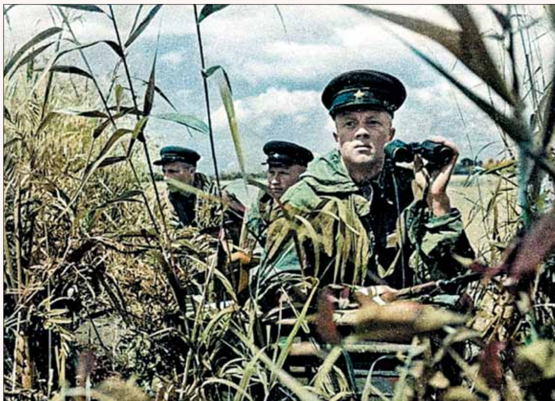
19 июня 1941 года. Пограничники в дозоре. В районе посёлка Вилково в дельте Дуная.

— Да не-ет, — откликнулся Иван, — я думаю, Гитлер не решится. После паузы продолжил, перейдя на быстрый горячий шепот: — Товарищ Сталин сказал, что войны