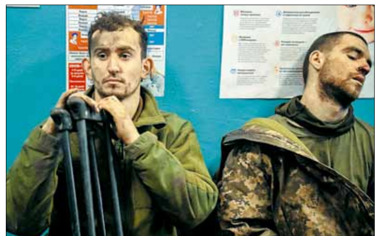
Попав в плен, боевики ВСУ начинают жаловаться на командование, бросившее «их на мясо».

Тезис, что мы воюем не с «братским украинским народом», а исключительно с нацистским бандеровским режимом, тоже не выдерживает никакой критики. А кто обстреливает жилые кварталы, рынки наших городов, кто сбрасывает бомбы с беспилотников на мирные автомобили в нашем глубоком тылу, в результате чего гибнут женщины и дети. Может быть, кто-то забыл, а я хорошо помню,