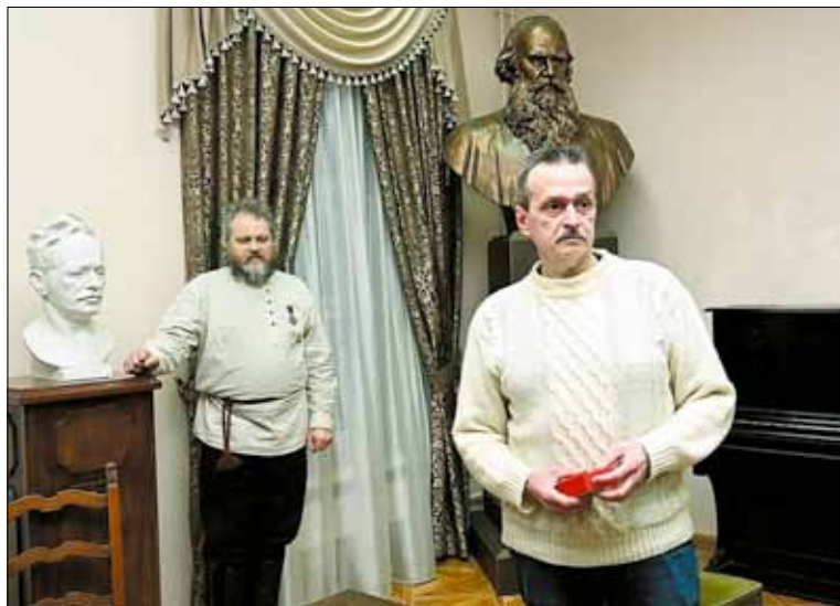
В 2021 году медалью «Вместе за одно!» были награждены участники обороны высоты Заглавак. Союз писателей России.