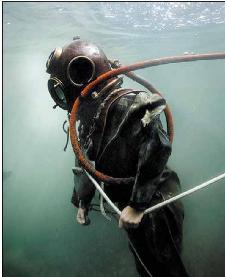
Водолаз на грунте. Экспедиция подводных работ особого назначения