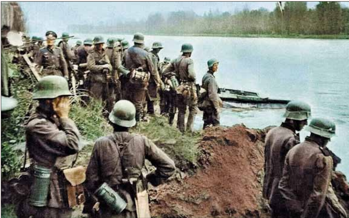
Перед вторжением. Солдаты гитлеровского Третьего Рейха ждут приказа Адольфа Гитлера о нападении на Советский Союз

◀ Стр. 11 — Чего пан желает? — по-русски, но с характерным польским акцентом спросил его с лёгким поклоном и услужливой улыбкой местный цирюльник. Он был одет в накрахмаленный белый халат, с которым никак не вязались его начищенные до блеска хромовые сапоги.