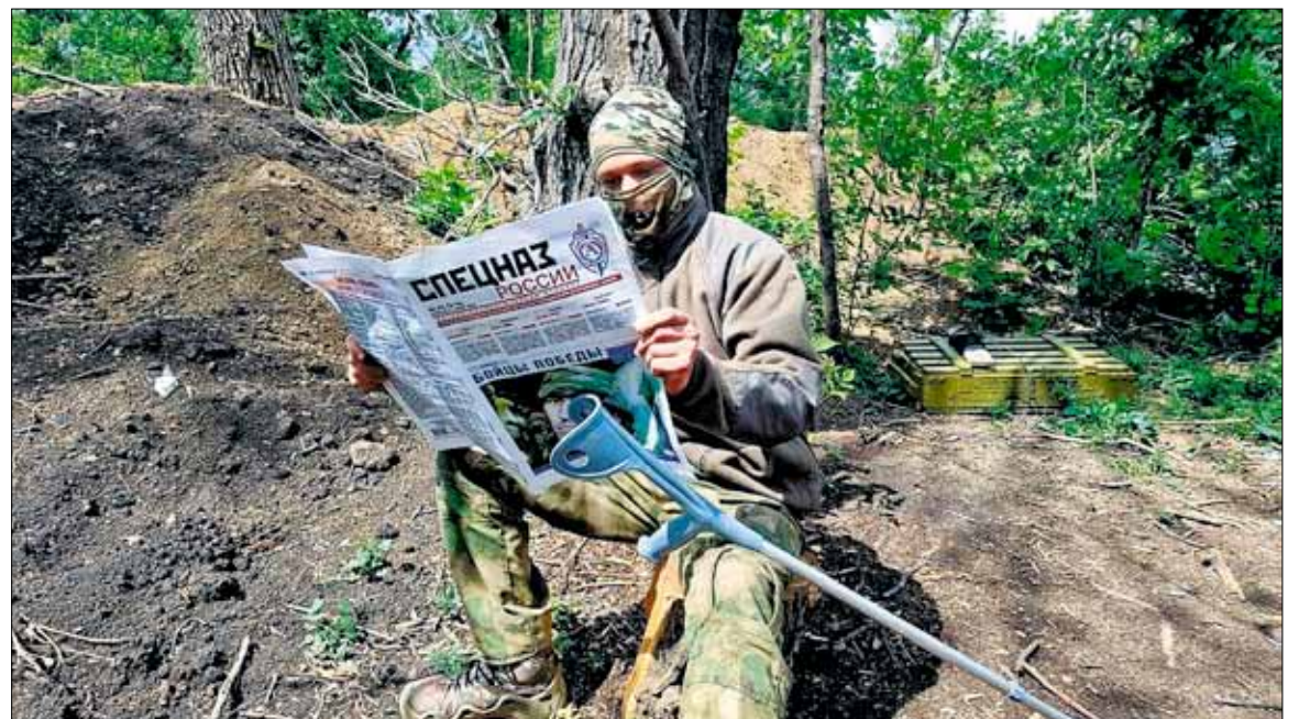
Привет с фронта СВО. Боец с газетой «Спецназ России». Официальному печатному изданию Международной Ассоциации «Альфа» исполнилось тридцать лет! Весна 2024 года

Те, кто до сих пор призывают к миру с Укро-Рейхом, готовят еще большую кровь в будущем. С нацистами и террористами не договариваются, их уничтожают.