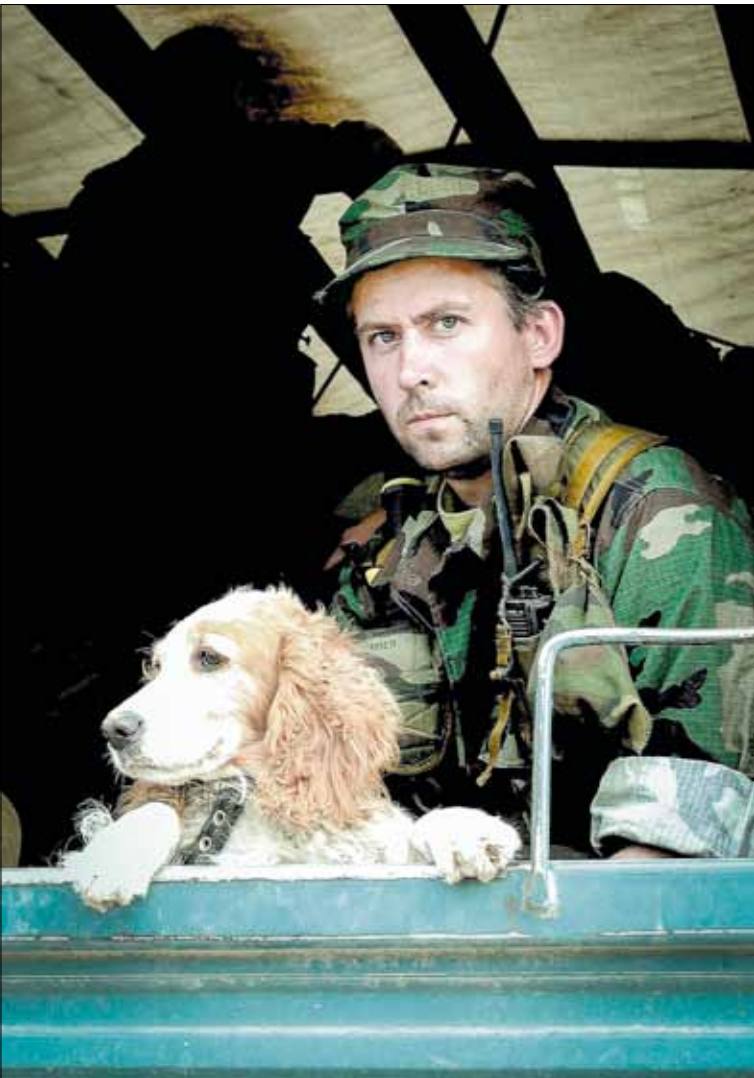
Работа кинологов с собаками не видна, однако она не менее важна, чем другие специальности в работе спецназа госбезопасности

чия этого взрывного устройства на борту, так как оно может быть приведено в действие пособниками террористов или взорваться по неосторожности.