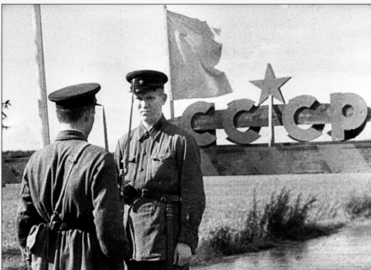
Пограничники НКВД СССР. 17-й Брестский Краснознаменный пограничный отряд. Июнь 1941 года

Шеф-редактор журнала «Разведчик», директор по развитию газеты «Спецназ России».