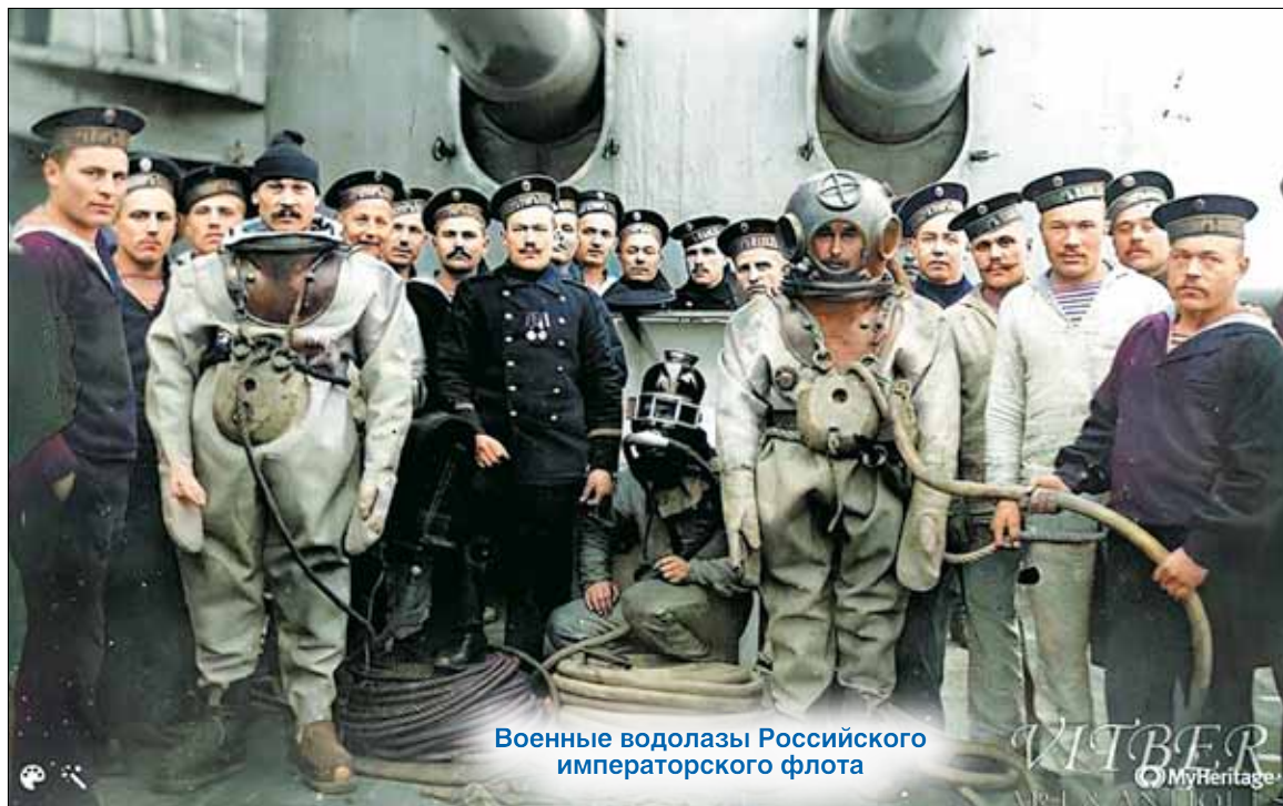
Военные водолазы Российского императорского флота