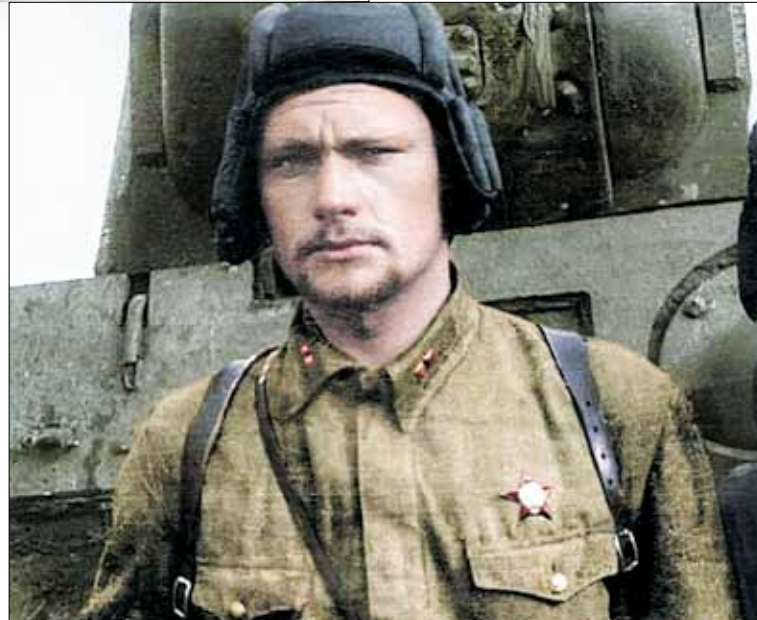
На пути Гитлера и его полководцев, покоривших почти всю Европу, встали безвестные герои, не позволившие врагу захватить Москву и Ленинград, Сталинград и Курск, всю нашу страну

История предательства генерала Павлова получила свое документальное подтверждение в работах целого ряда современных исследователей. Теперь мы знаем наверняка: все необходимые решения по отражению агрессора в середине июня 1941 года руководством страны (как бы к нему не относились!) были приняты.