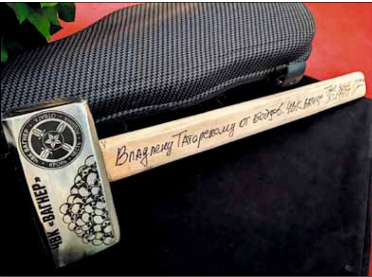
Один из символов борьбы с нацизмом и предательством. Владлену Татарскому от бойцов ЧВК «Вагнер». Кувалда, которую на церемонию прощания с военкором принёс Евгений Пригожин

и для чего был устроен тогдашний Петроградский Майдан.