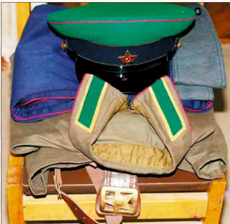
Фуражка, гимнастёрка, галифе, ремень и портупея советского пограничника времён Великой Отечественной войны

махером работал. Наш офицер зашёл подстричься, так он его опасной бритвой зарезал и в люк под креслом сбросил. Только не знал, сволочь, что офицера этого солдаты на улице ждали. Заходят они, спрашивают, где, мол, офицер. А он говорит, что ушёл пан офицер, подстригся и ушёл. Ну, начали они его цирюльню шмонать. Его обыскали, нашли документы нашего офицера, припёрли к стенке, он и показал этот потайной люк. Так, представляете, эта падла под халатом даже френч свой польский продолжала носить!