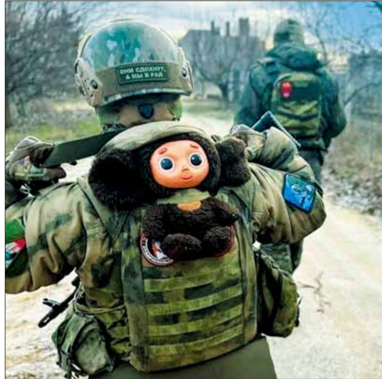
У каждого солдата на войне свой талисман. Чебурашка — один из русско-советских символов, который ненавистен майданам и украинским нацистам

Несмотря на разный разрез глаз и родной язык, для Запада мы все русские. Фронтное братство СВО это доказывает. В этом заключается русский