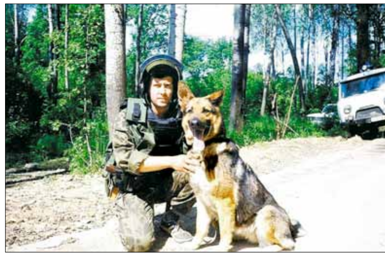
«В Кинологическом Центре ФПС России в городе Вязьма я сдал экзамены на диплом кинолога минно-розыскной службы»

Кроме участия в оперативно-боевых мероприятиях, мы выполняли и специальные задачи, такие как обеспечение безопасности президента России. Дважды вылетали в Таджикистан, Азербайджан, участвовали в обе-