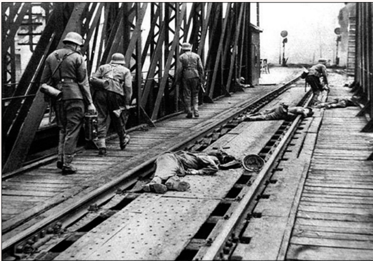
Первый день войны в Перемышле. Город был занят врагом 22 июня, но на следующее утро освобождён частями РККА и пограничниками. Удерживался до 27 июня