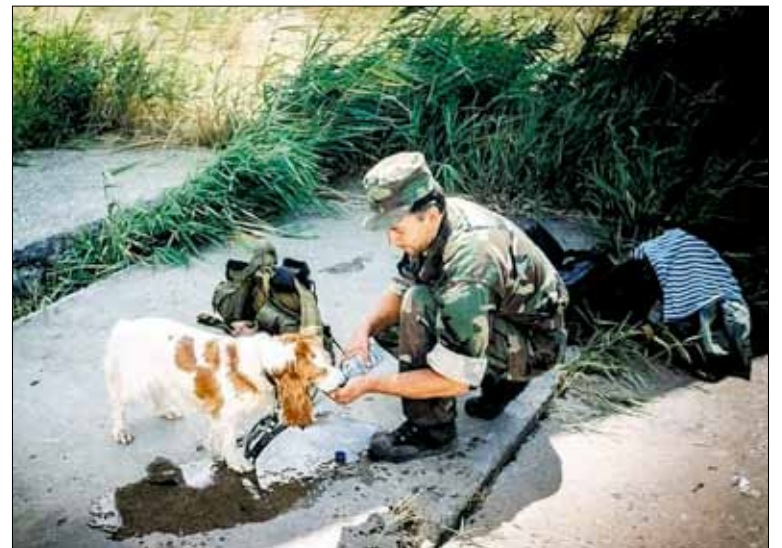
«Все собаки пристраиваются на дожитие по нашим сотрудникам или друзьям»

Это был благоприятный момент для перехода, и я решился. На мандатной комиссии я немного нервни-