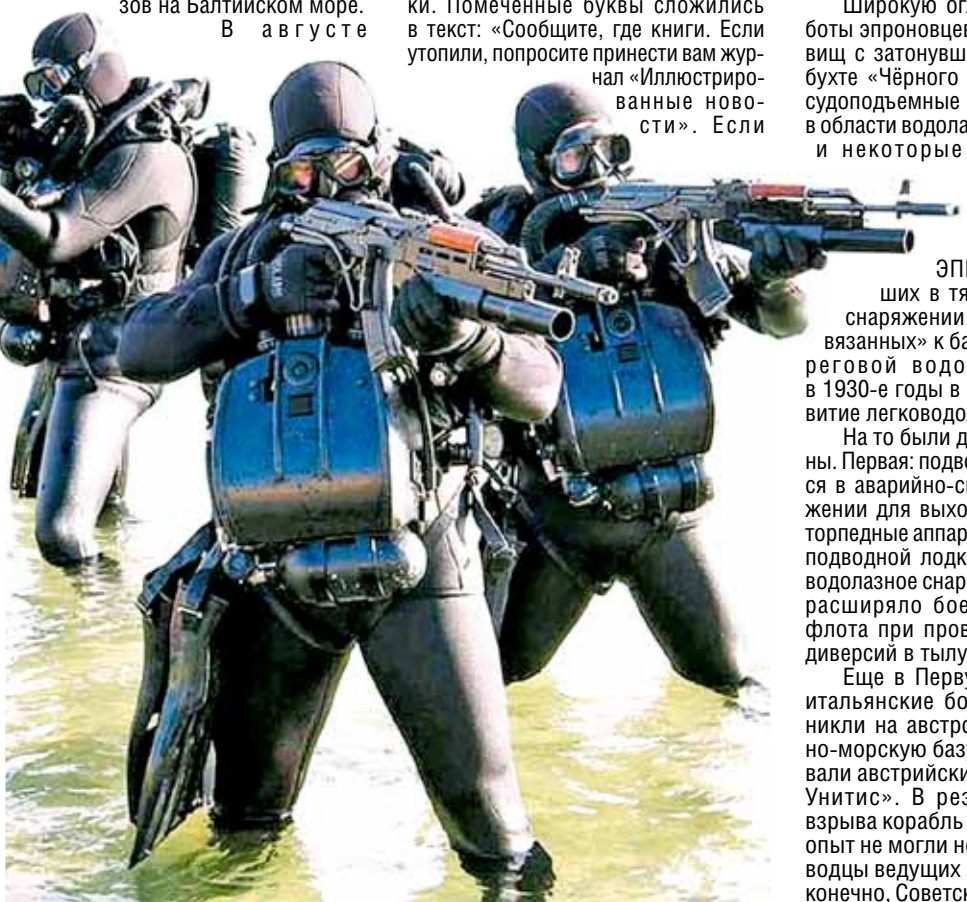
Современные боевые пловцы. Свою родословную ведут от Водолазной школы, созданной по указу императора Александра III 23 апреля (5 мая) 1882 года в Кронштадте

Исторически сложилось так, что в конце 1930-х в СССР еще не производились ни акваланги, ни даже ласты. Поэтому советские боевые пловцы не плавали, а буквально ходили по дну! Их так и называли — «подводными пехотинцами».