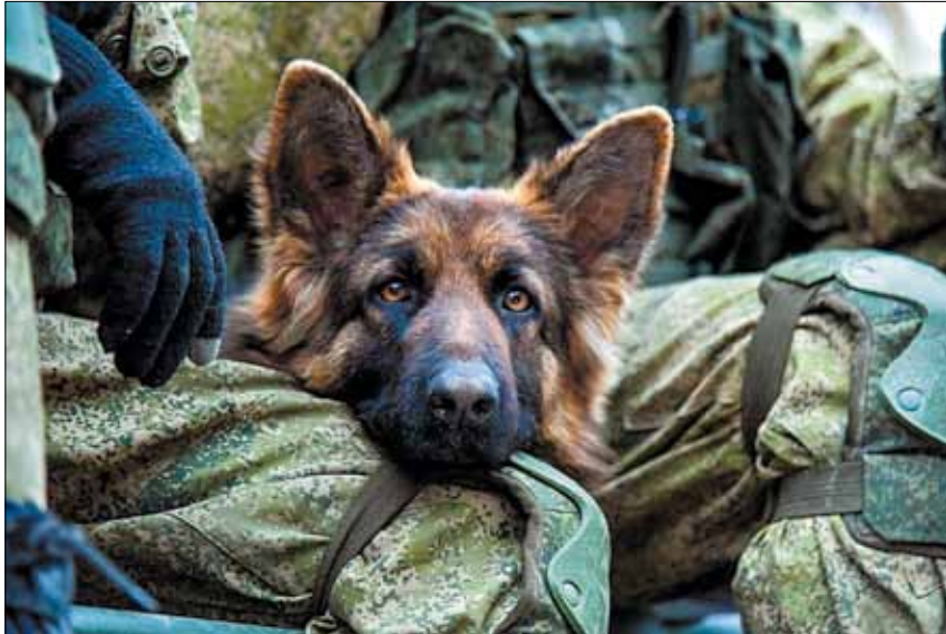
«Живу с Человеком раз... два... три... четыре... пять... шесть недель в блиндаже, с ним ещё люди, ото всех пахнет дымом и порохом...»

Порох опасен... Я его чую... Пахнет дымом, потому что лес за селом горит после большого бабах. Человек назвал этот бабах — обстрел и попросил