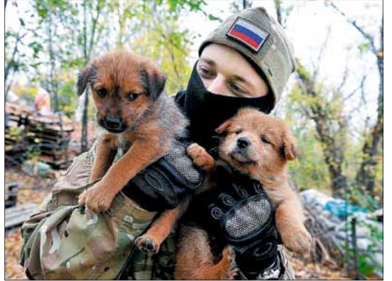
На передовой бойцы СВО подбирают брошенных собак и кошек

Газета «Спецназ России» (официальное издание Международной Ассоциации ветеранов подразделения антитеррора «Альфа») объявляет творческий конкурс на лучшее литературное произведение на тему СВО.