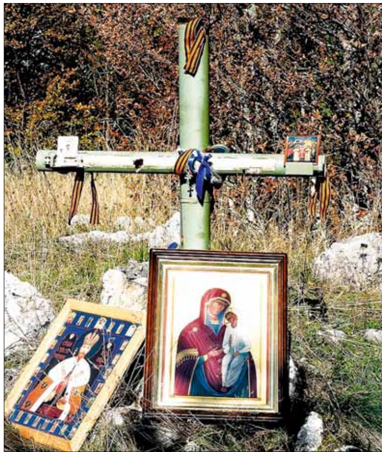
Крест и православные иконы на высоте Заглавак, политой русской кровью. Восточная Босния

В 1991-1992 годах начался распад Югославии. Под воздействием внешних сил распад этот принял кровавые формы. В апреле 1992 года полыхну-