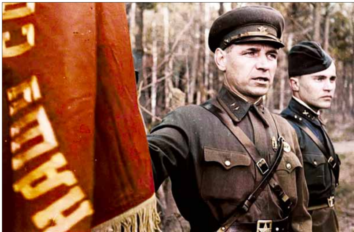
В отличие от западных армий, РККА не разбежалась перед Вермахтом и его союзниками, несмотря на тяжелейшие потери в личном составе и военной технике