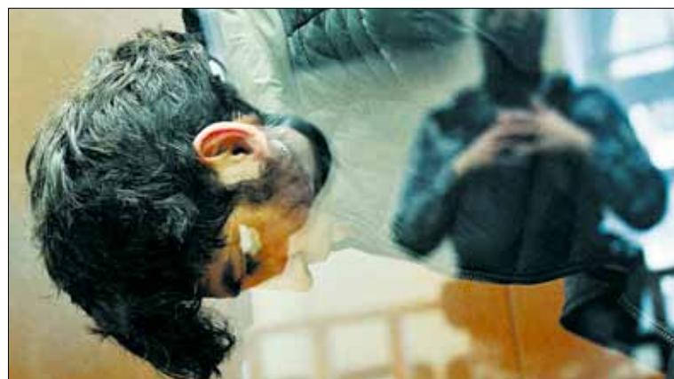
Один из фигурантов дела о теракте в «Крокусе» в зале суда.

Автор — шеф-редактор журнала «Разведчик», директор по развитию газеты «Спецназ России», Ветеран Группы «А» КГБ СССР. ■