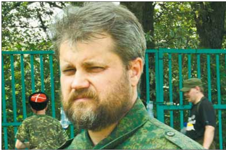
«Этот бой является ярчайшим эпизодом русского добровольческого движения и достойным примером для подрастающего поколения (Александр Кравченко)»

ла война в Боснии и Герцеговине. Официальная Россия в тот момент впервые встала на сторону неприятелей сербского народа, поддержав международные санкции. Естественно, что большая часть нашего народа не разделяла позицию правительства Ельцина. Доказательства этому — появление на сербских фронтах немало количества русских добровольцев.