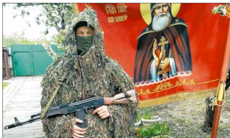
Братишкам и сестренкам, сражающимся на Донбассе, Херсонщине и Запорожской земле, удачи во всем!

иметь силы быть наследниками их трудной работы.