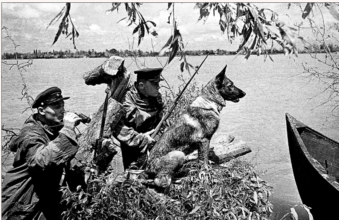
Пограничники ведут наблюдение в районе посёлка Вилково в дельте Дуная. Июнь 1941 года.

— Так точно, товарищ лейтенант. Конечно, идите. Мы подождём.